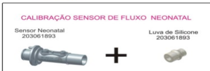
Figura 23: Componentes para calibração do sensor de fluxo neonatal.

Na calibração do sensor de fluxo Neonatal deve-se utilizar :