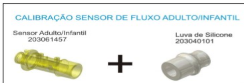
Figura 22: Componentes para calibração do sensor de fluxo adulto/infantil

Na calibração do sensor de fluxo adulto/infantil deve-se utilizar :