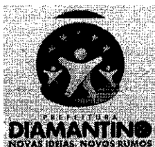
EDUARDO CAPISTRANO DE OLIVEIRA Prefeito Municipal