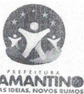
EDUARDO CAPISTRANO DE OLIVEIRA Prefeito Municipal