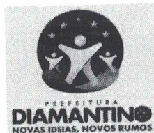
EDUARDO CAPISTRANO DE OLIVEIRA Prefeito Municipal